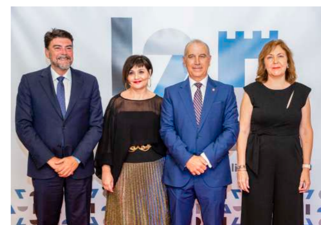
El alcalde de Alicante, la vicepresidenta 1ª y el presidente del COMA y la vicepresidenta 1ª del CGCOM.