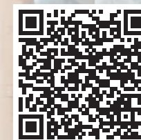
Consultar las bases