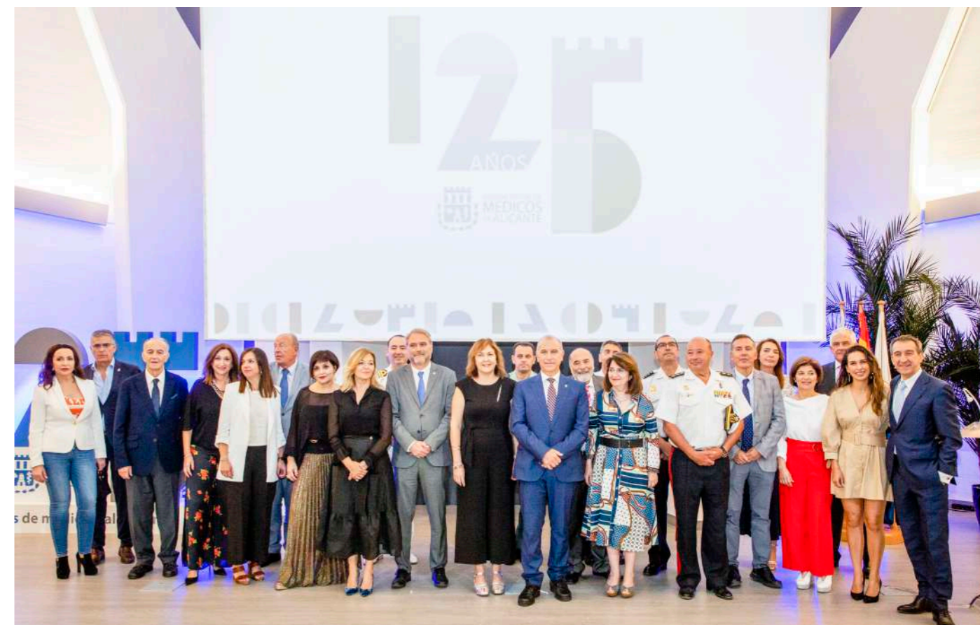
Foto de familia de la Junta Directiva y autoridades tras finalizar el acto en el auditorio del Palacio de Congresos de Alicante.

A todos los que estuvieron y a los que están se les agradeció su trabajo, dedicación y compromiso con la salud de la ciudadanía proyectándose un vídeo, con la participación de colegiados, en el que se destaca la figura del facultativo como motor del sistema sanitario. En este vídeo, la Junta Directiva ha querido, además, lanzar