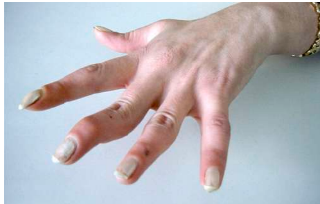
Lupus eritematoso sistémico. Mano con artropatía de Jaccoud. Deformidades en 'cuello de cisne'. Galería de imágenes de la SER. Cortesía del Dr. Miguel A. Belmonte.

Pese a su antigüedad, la hidroxiclороquina sigue jugando un papel protagonista en el tratamiento del LES, con eficacia demostrada en el mantenimiento de la estabilidad, en evitar la aparición de brotes y en mejorar la supervivencia. Es imprescindible monitorizar