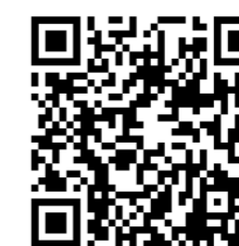
Accede al vídeo del 125 aniversario