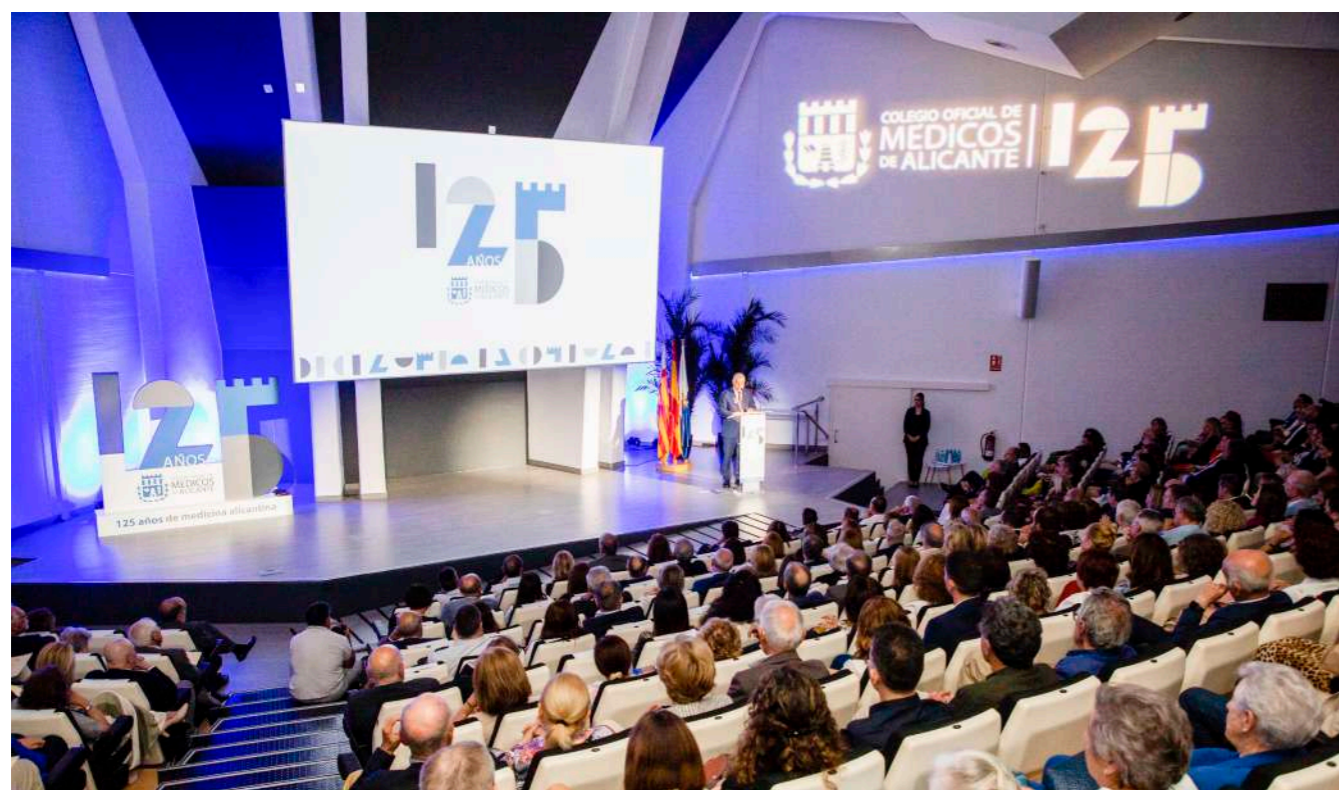
Al acto asistieron más de 500 personas entre colegiados, autoridades y representantes del sector sanitario, económico y social de la provincia.