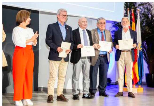
Homenajeados por las Bodas de Oro.