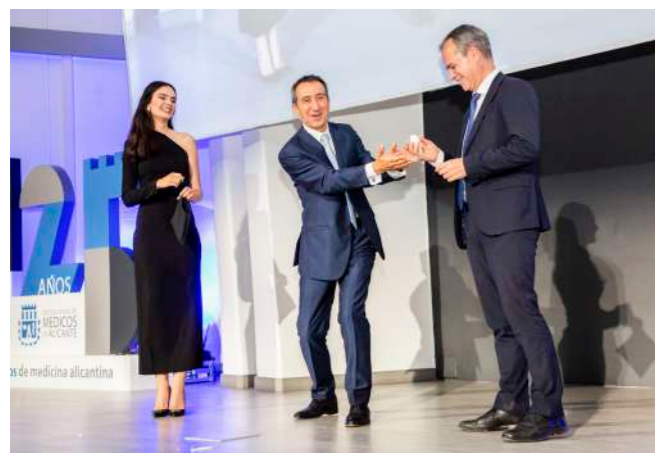
La gala, divertida y también emotiva, fue conducida por el presentador y mago Luis Boyano. Al finalizar el evento se ofreció un cóctel en el restaurante del Palacio de Congresos de Alicante del COMA.