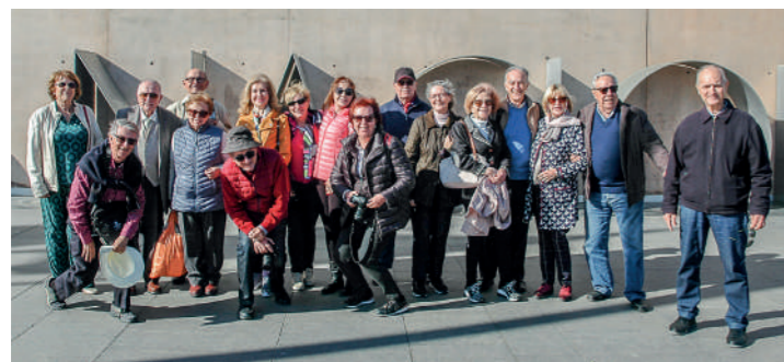
Excursión al Museo del Foro Romano en Cartagena