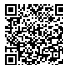
Fotogalería del photocall y la gala