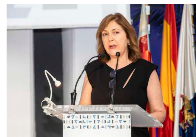
La vicepresidenta 1ª del CGCOM.