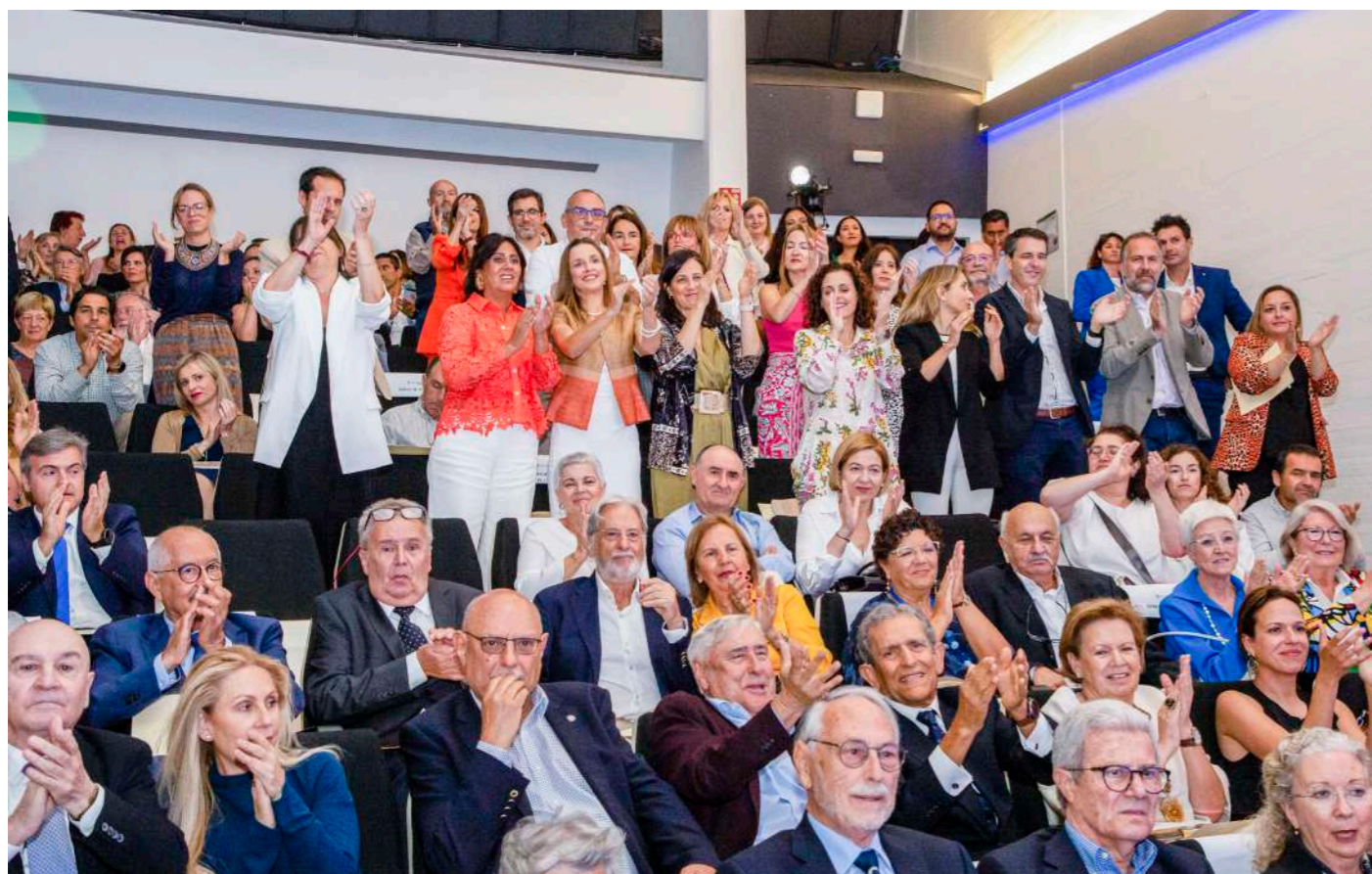
Asistentes a la gala se levantan a aplaudir a los compañeros que reciben las Bodas de Platino.