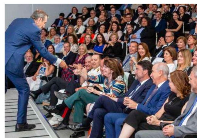
El presentador durante su actuación.