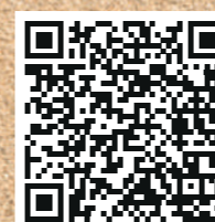
Bases del concurso

Plazo de presentación de las obras: 30 SEPTIEMBRE 2023