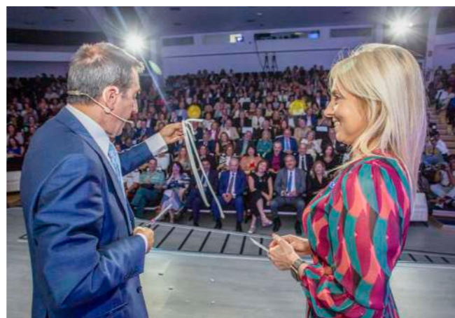
El público intervino durante la gala.