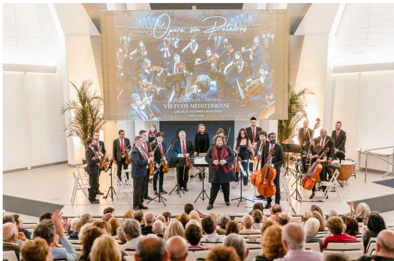
'Ópera sin palabras' de la Orquesta Virtuós Mediterrani.