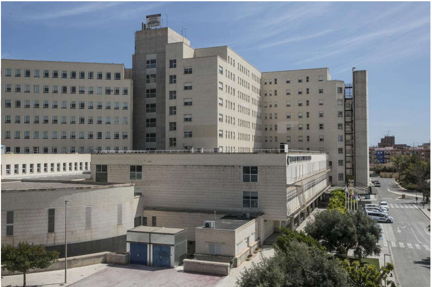
Imagen del Hospital General de Alicante. Pilar Cortés

El Sindicato Médico de la Comunitat Valenciana (CESM CV) ha pedido la dimisión del gerente del Hospital General de Alicante por ser el Departamento de salud con más profesionales sanitarios contagiados de COVID-19 de toda la región, con 146 casos hasta el 9 de abril.