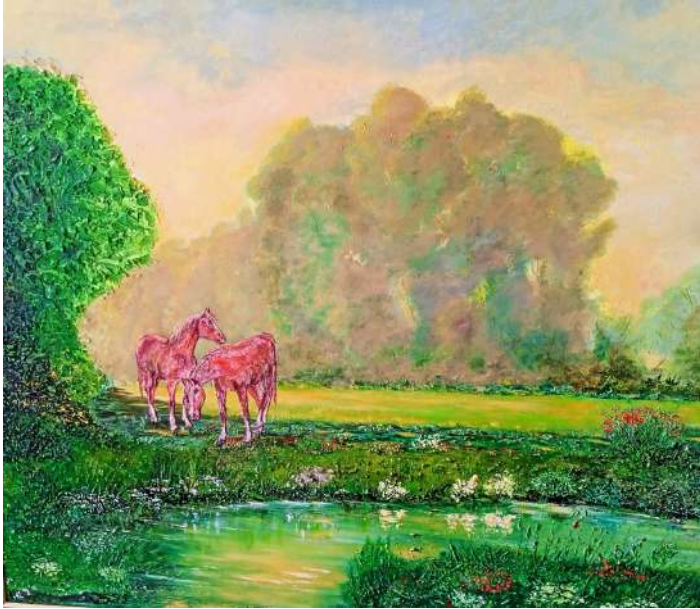
CABALLOS EN EL RIO