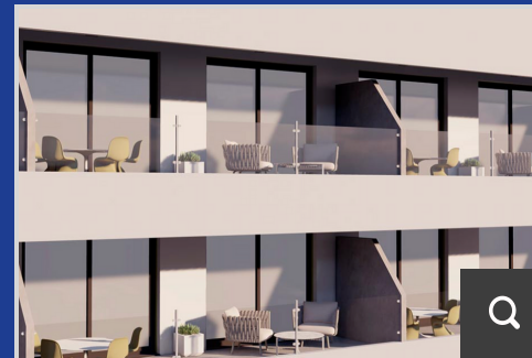
MH Built to Rent

En Modular Home seguimos evolucionando y cuidando todos los detalles de las viviendas que construimos.