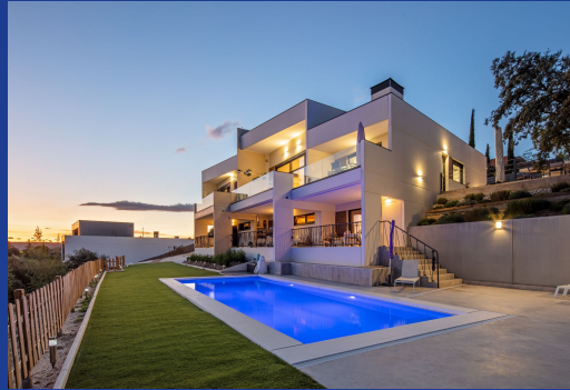
Casas de Autor