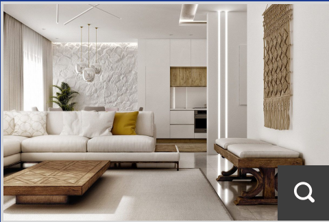
Interiorismo y Paisajismo