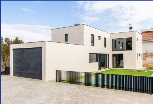
Casas a Medida