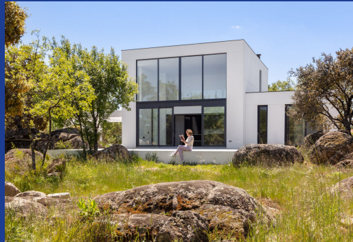
Casas con Parcela